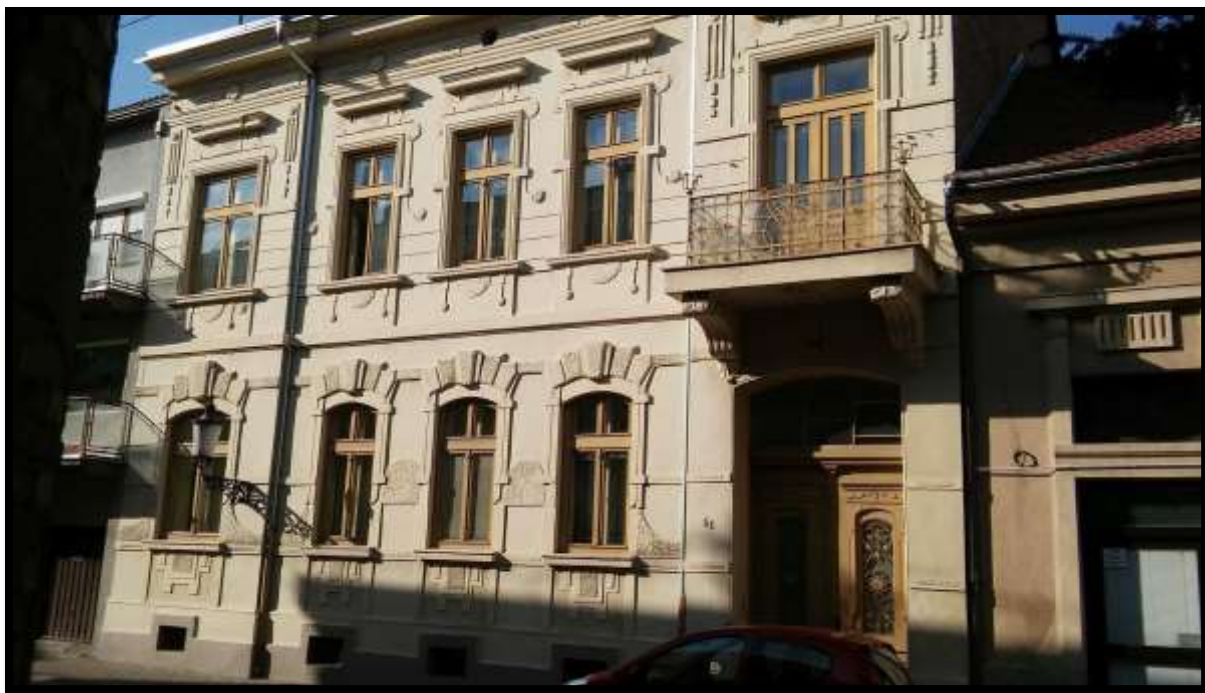
Secesijska katnica u ulici Ante Starčevića br. 51