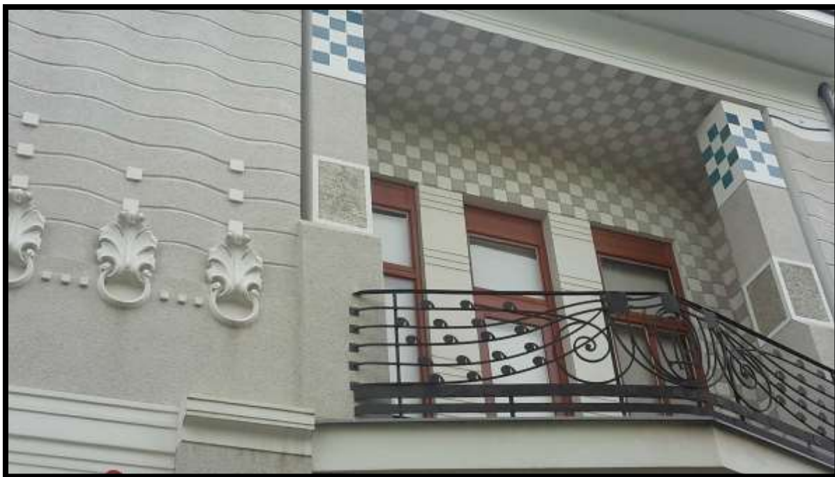
Detalj pročelja, Petra Krešimira IV. br. 24