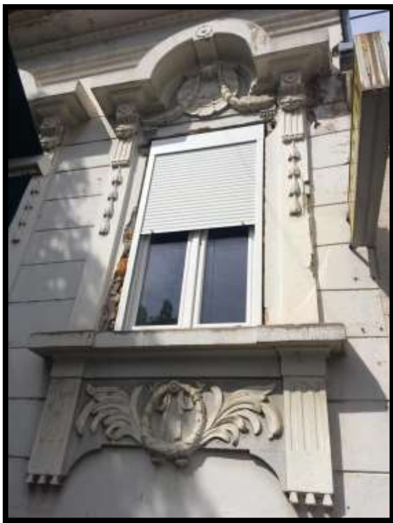
Detalj pročelja u ulici Augusta Cesarca br. 15