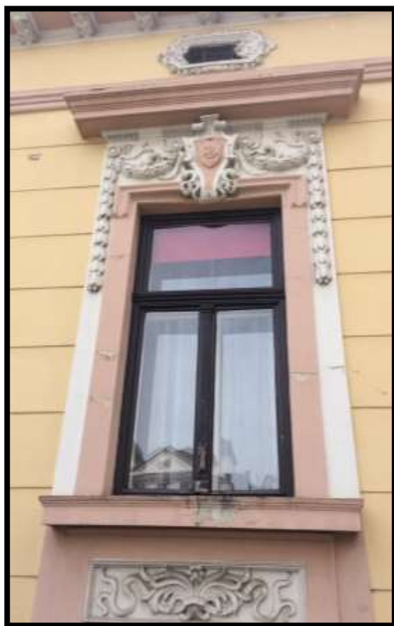
Detalj pročelja u ulici Matije Mesića br. 14