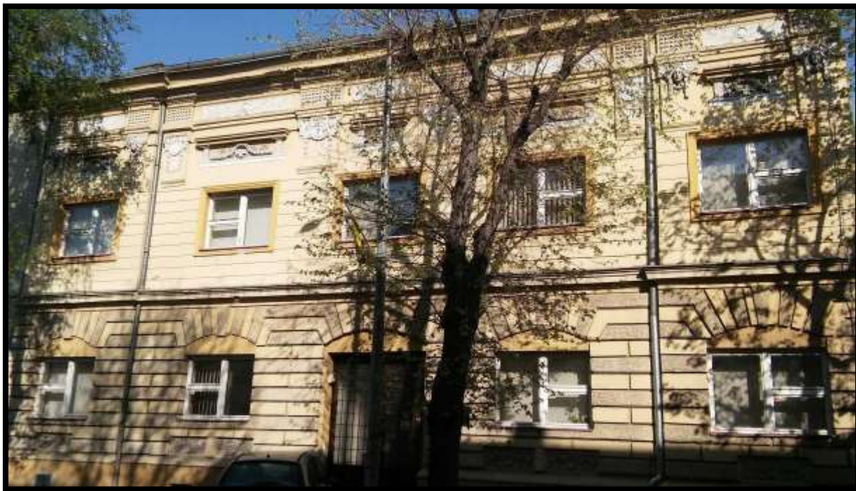
Zgrada Veleučilišta Slavonski Brod u ulici Matije Gupca br. 24