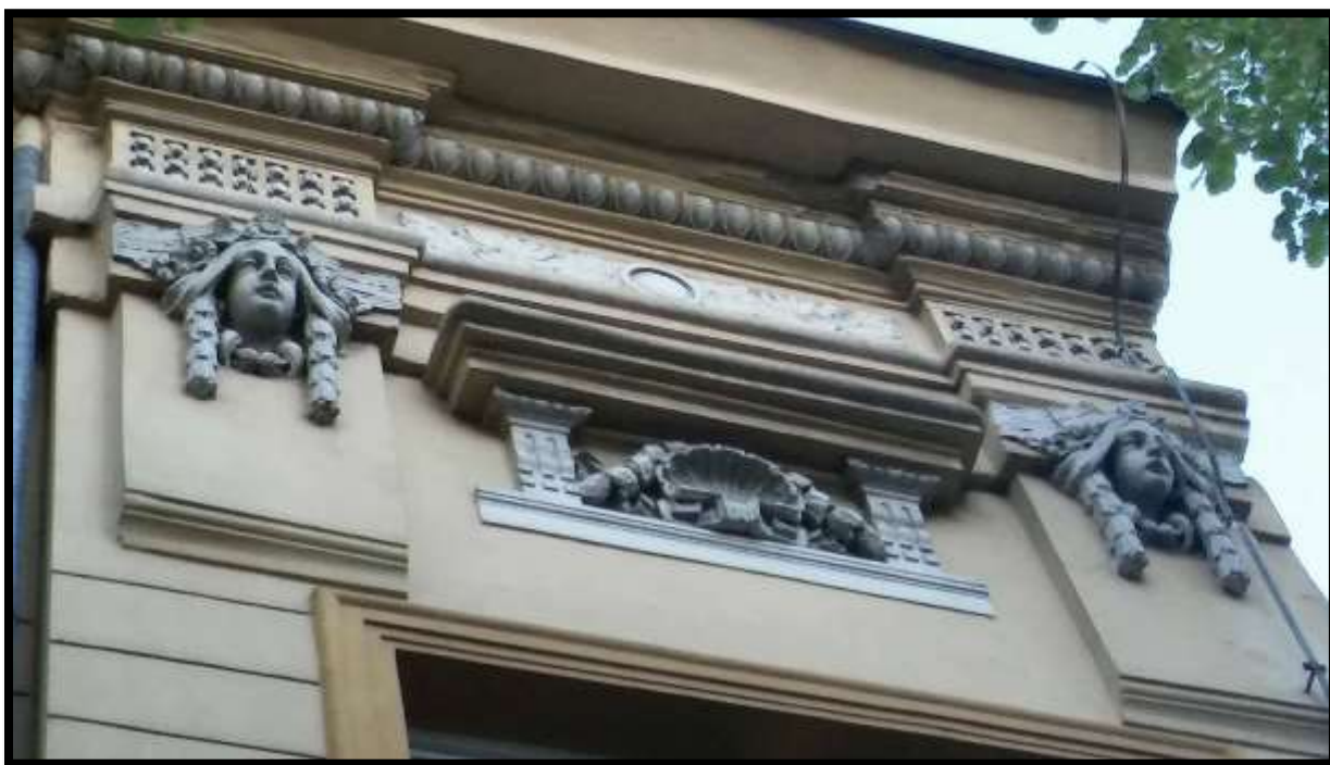
Detalj pročelja, Matije Gupca br. 24