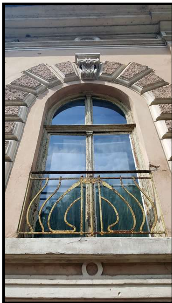
Ograda od kovanog željeza na prozoru prizemnice u ulici Ante Starčevića br. 53.