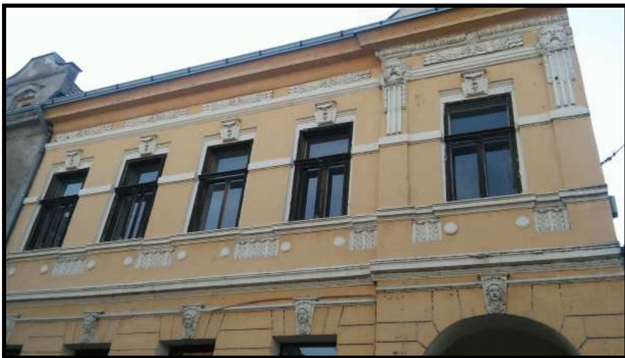
Ivana pl. Zajca br. 15