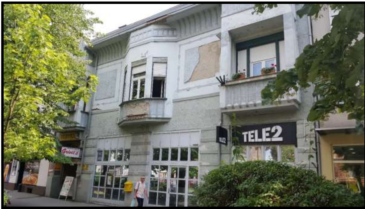
Kuća Tauchmann u ulici Petra Krešimira IV. br. 32