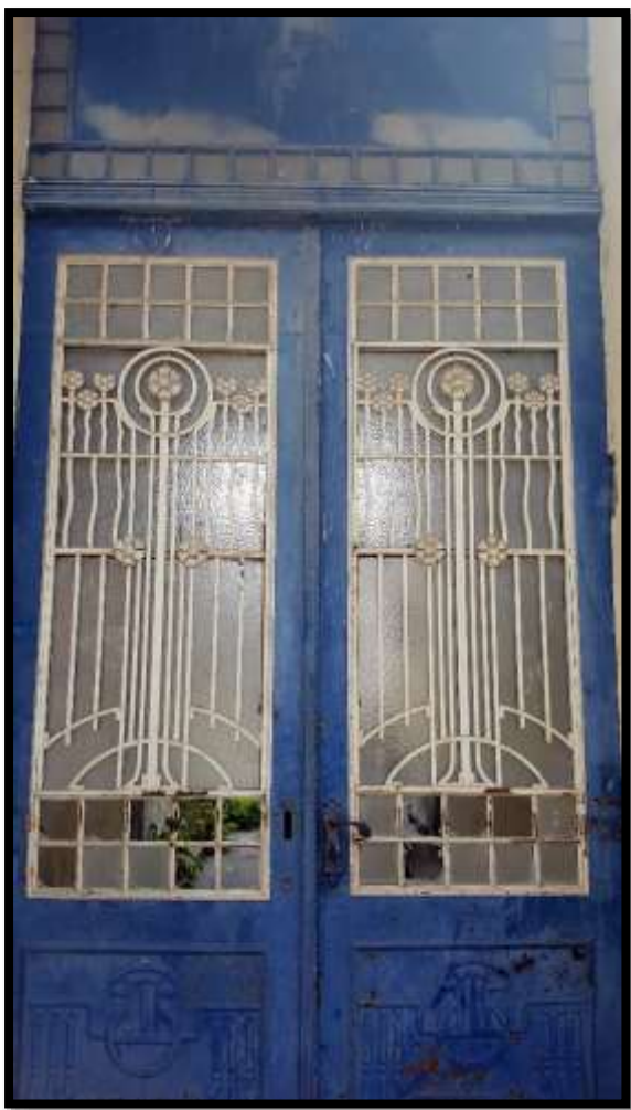
Vrata haustora u ulici Ante Starčevića br. 26