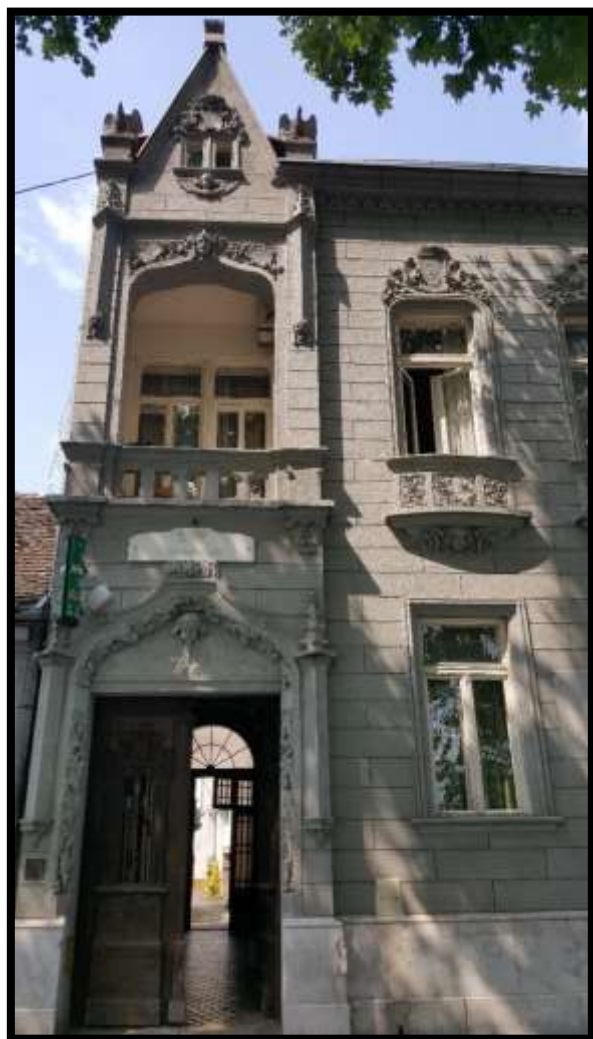
Palaču Selinger na Šetalištu braće Radić br. 6 projektirao je jedan od pionira secesijske arhitekture u Hrvatskoj, Vjekoslav Bastl.