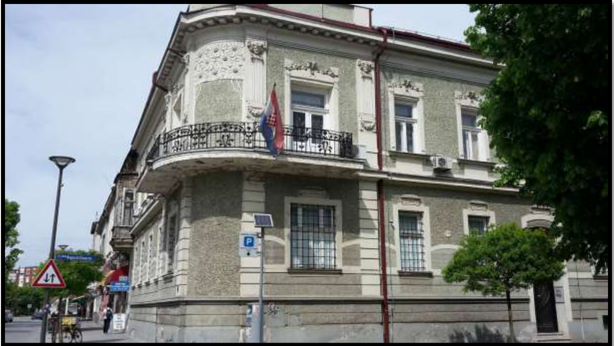
Palača Samuela Koppa u ulici Augusta Cesarca br. 1, danas Državni arhiv