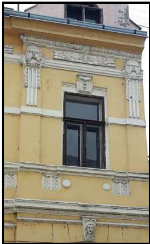
Detalj pročelja katnice u ulici Ivana pl. Zajca br. 15

Jedina preživjela gradska vila nekadašnjeg naselja Jankomir, danas skrivena zgradom Hrvatskog zavoda za