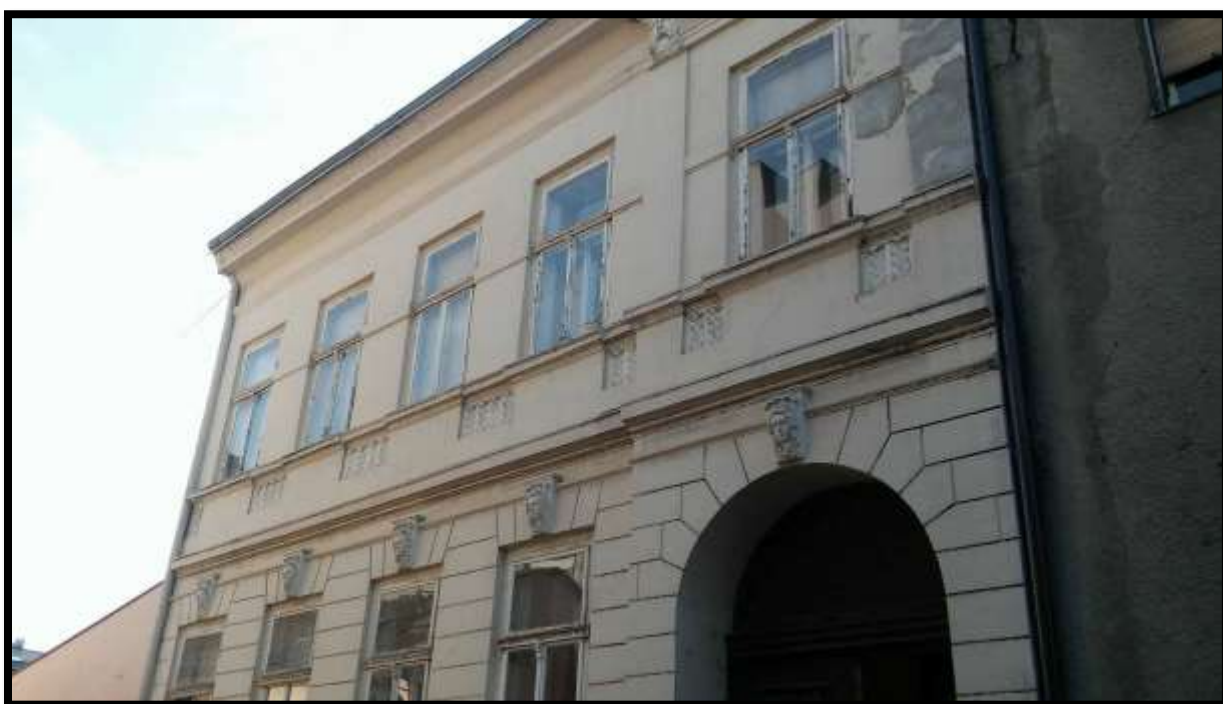
Ivana pl. Zajca br. 13