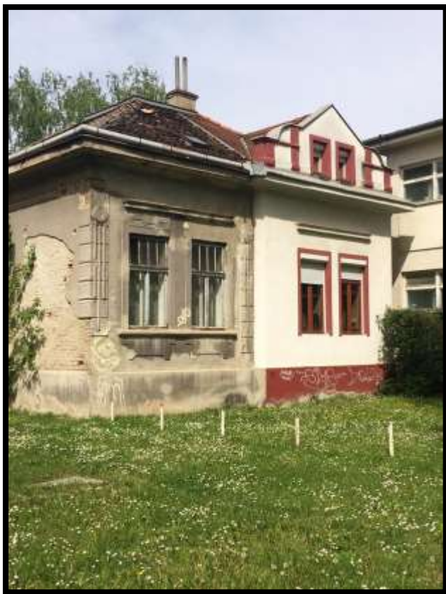
Trg Pobjede 7, južno pročelje