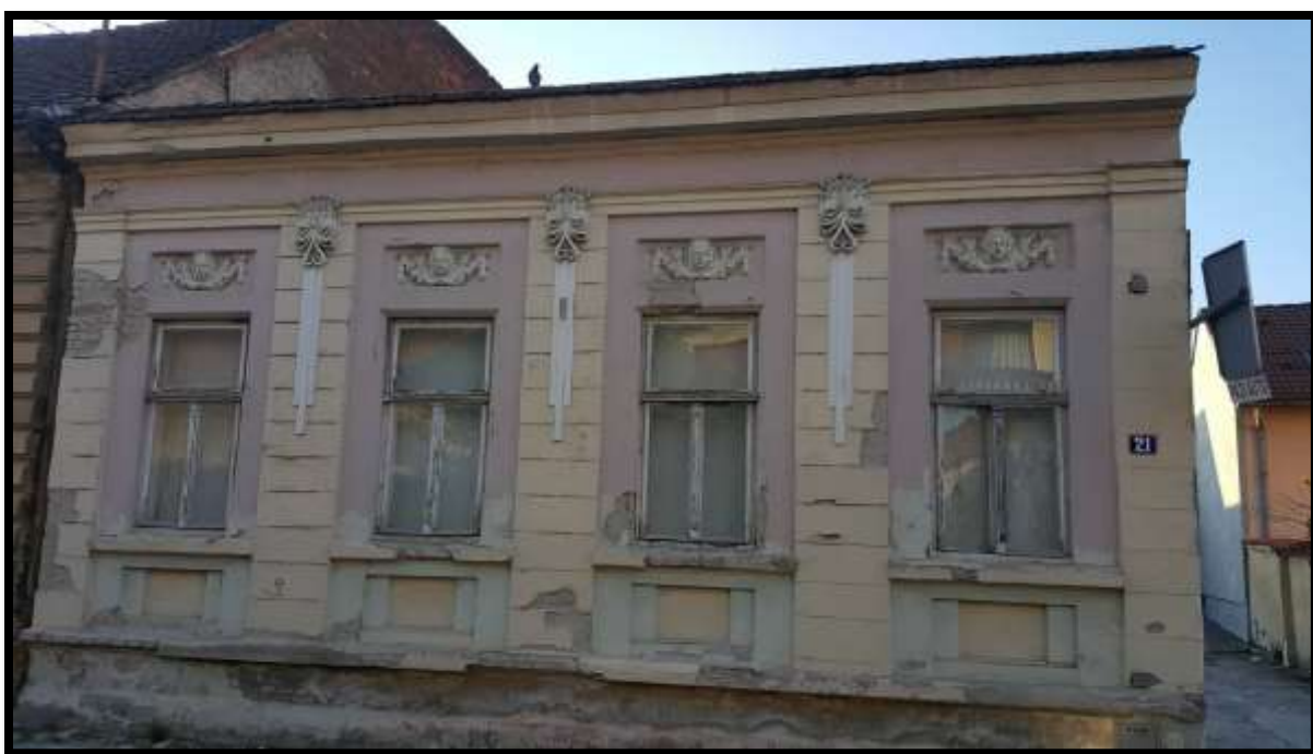
Još uvijek očuvano pročelje prizemnice u ulici Ljudevita Gaja br. 21